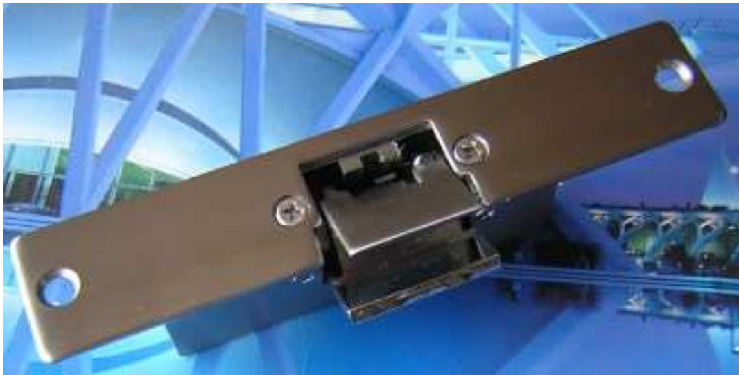
Trinco aberto à espera da porta