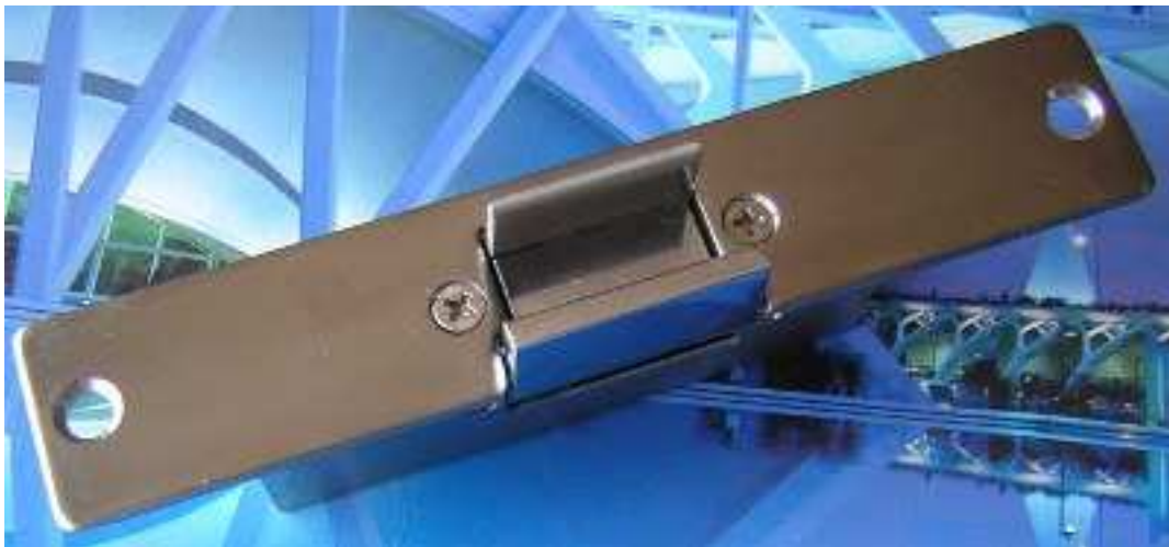
Trinco fechado com a porta de vidro encaixada